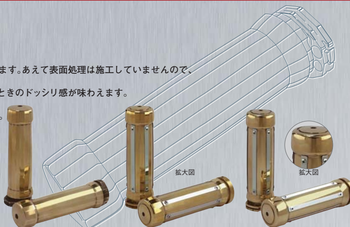
正十八角形ゴールドグリップ 31,500円(税込)

品名：ゴールドグリップシリーズ 材質：真鍮 (研磨仕上げ、内径φ25.7mm) 数量：2ヶ1組 ※商品代金には、別途送料+消費税が必要です。 ※受注生産で、1つずつ丁寧に製作したいので、納期は受注後1週間~10日ほど頂きます。